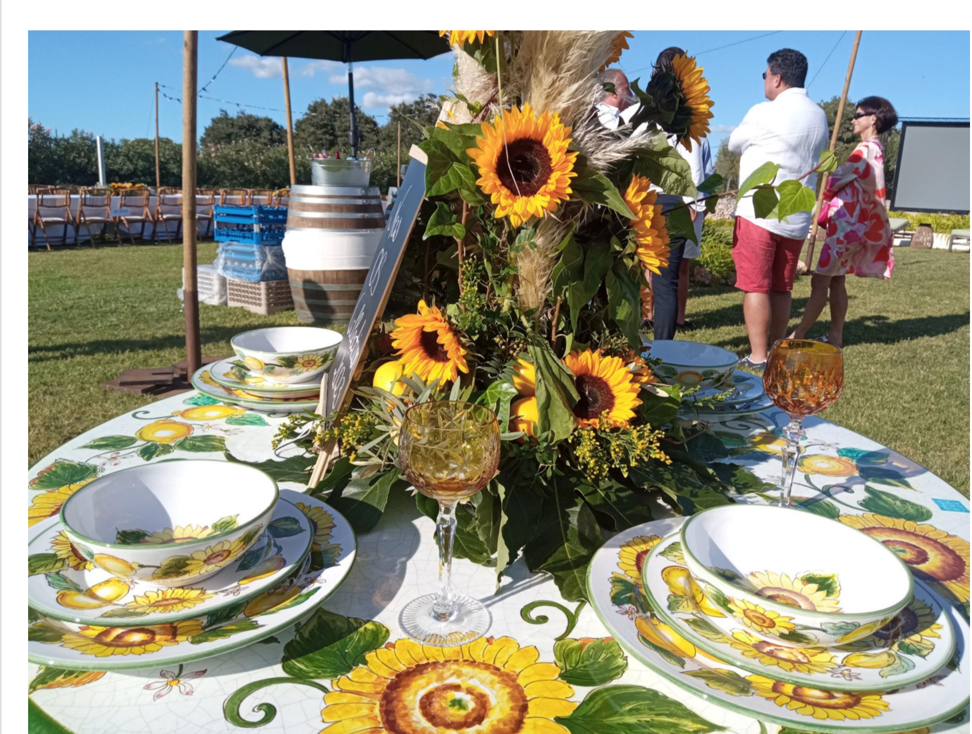
Blumenschmuck an einem der Gartentische.