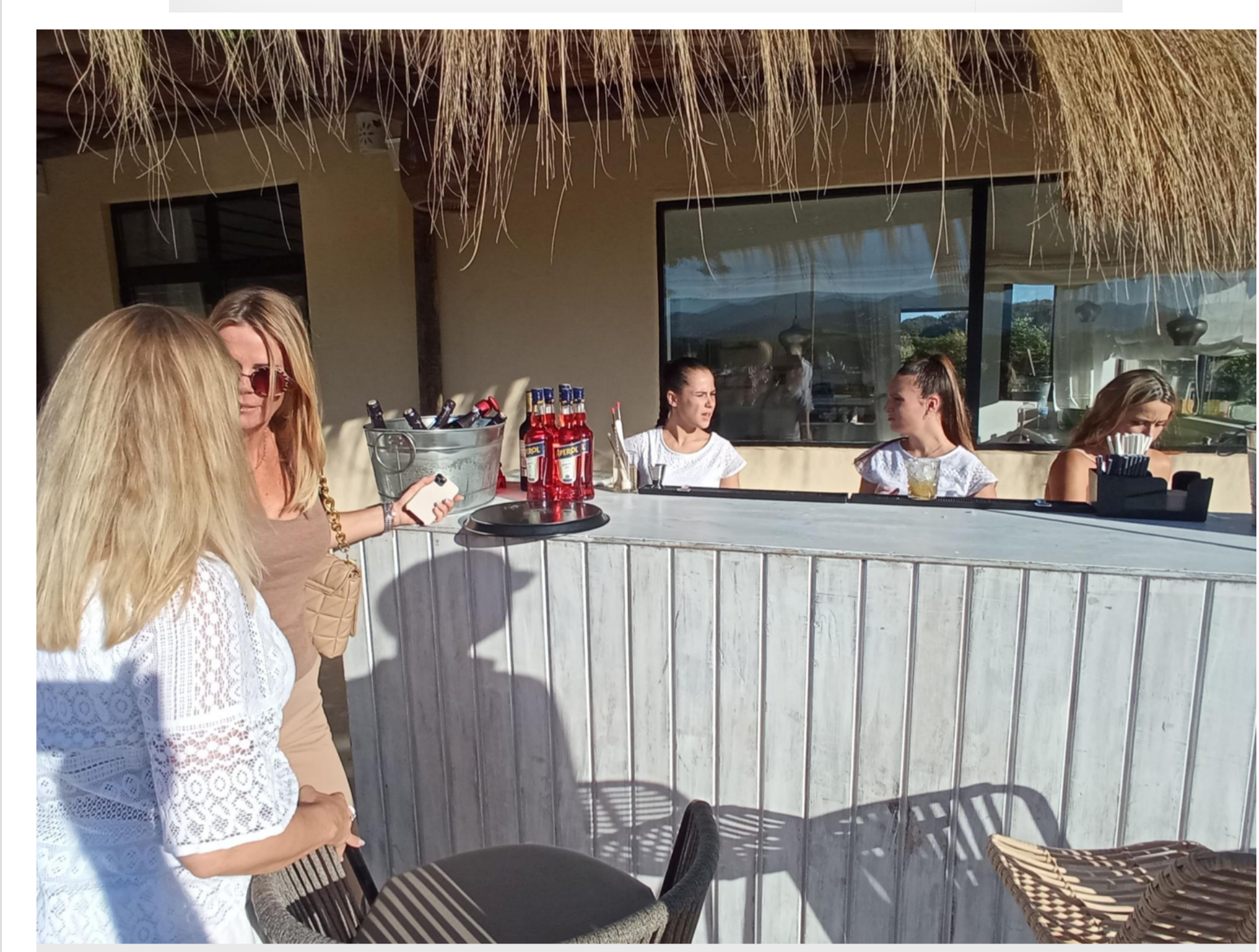
Gäste der Gartenparty beim Aperol Spritz.