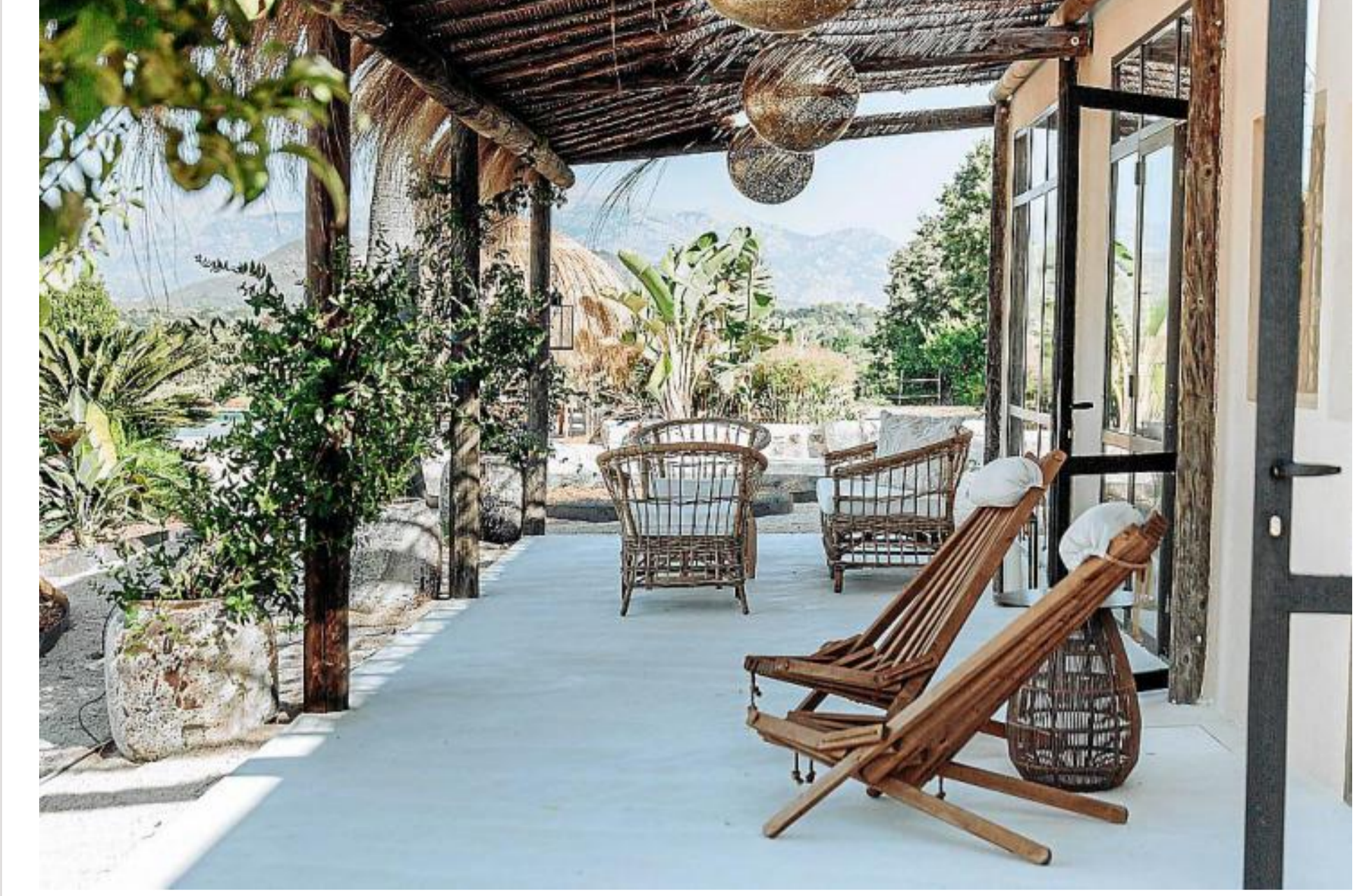
finca only summer llubi fiesta

Ingo Thor | Llubi, Mallorca | 07.10.22 15:17